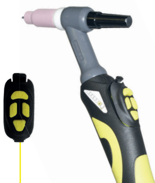
Szybkowymienny mikrowyłącznik SPARTUS® Pro 4B ze zdalnym sterowaniem UP & DOWN

Najwyższej klasy oryginalny i polski uchwyt spawalniczy SPARTUS® ProTIG z szybkowymiennym mikrowyłącznikiem 4B ( UP & DOWN ). Niewielki niezbędnik części eksploatacyjnych pozwala na szybką wymianę zużywających się części. Uchwyty zawierają elastyczny pakiet przewodów w oplocie bawełnianym z 1m skóry za rękojeścią.