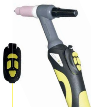
Szybkowymenny mikrowyłącznik SPARTUS® Pro 4B ze zdalnym sterowaniem UP & DOWN

Najwyższej klasy oryginalny i polski uchwyt spawalniczy SPARTUS® ProTIG z szybkowymennym mikrowyłącznikiem 4B ( UP & DOWN ). Pakiety dostępne są z uchwytem (4/8m) na rękojeści standardowej lub poręcznej i lekkiej mini rękojeści. Niewielki niezbędnik części eksploatacyjnych pozwala na szybką wymianę zużywających się części. Uchwyty zawierają elastyczny pakiet przewodów w oplocie bawełnianym z 1m skóry za rękojeścią.