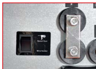
Włacznik trybu Spool Gun.