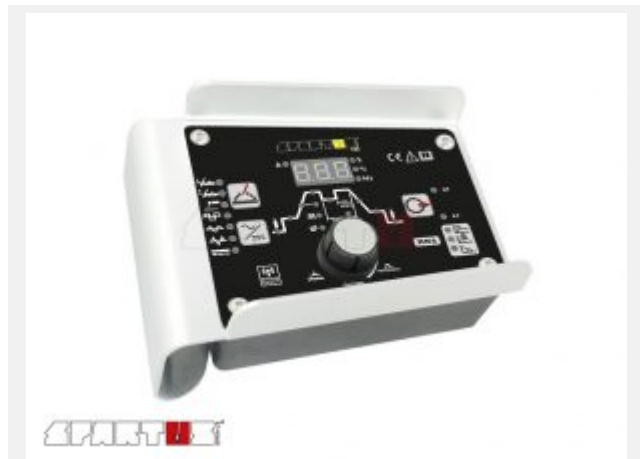
Pilot zdalnego sterowania TIG 320P/400P AC/DC