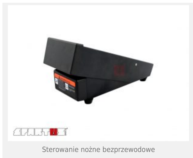
Sterowanie nożne bezprzewodowe