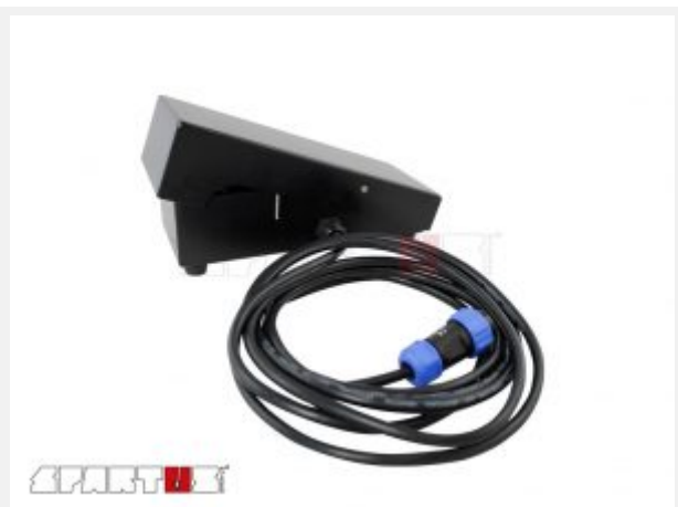
Sterowanie nożne przewodowe